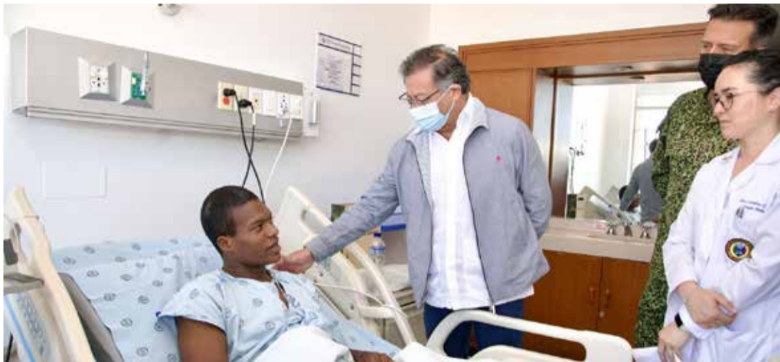
El presidente Petro, visitando uno de los soldados heridos en el ataque del ELN

Al referirse al ELN, el jefe de Estado recordó que le ha dicho a este grupo armado ilegal en distintas ocasiones que hay dos opciones: «O el camino de Pablo Escobar o el camino del sacerdote Camilo Torres Restrepo, el que hablaba del amor eficaz, del amor a los pobres, del amor a los humildes, del amor a los que más su-