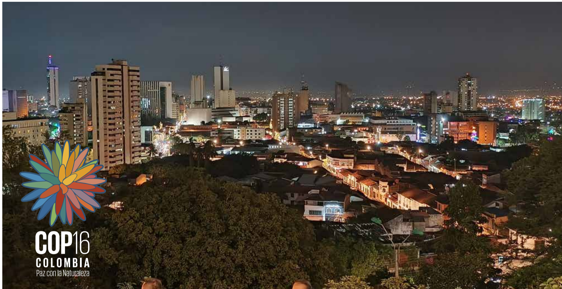
Santiago de Cali, sede de la COP16