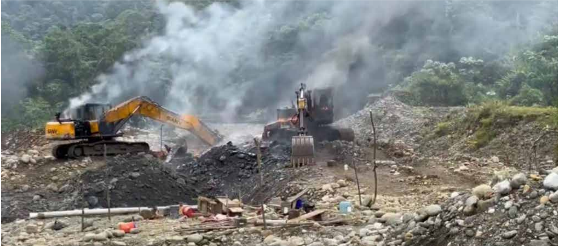
La orden del gobierno nacional es acabar con la minería ilegal.