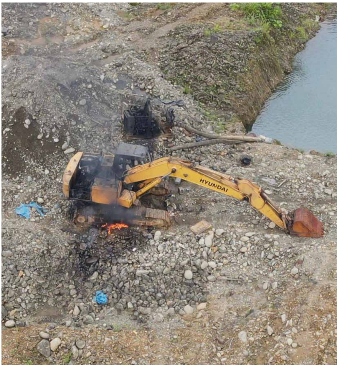
Los daños ambientales en la costa pacífica del Cauca son grandes.

dos (02) motobombas las cuales fueron inutilizadas de acuerdo a los proto-