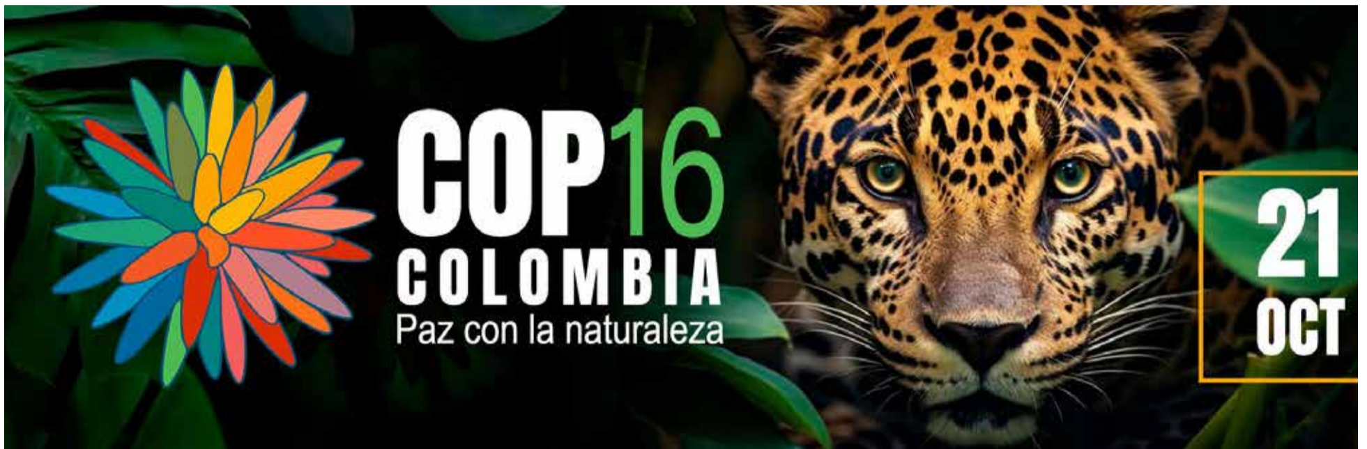
Hoy se inicia en Cali el encuentro ambiental más importante del mundo

« La COP 16 de la biodiversidad tiene tanta importancia mundial que solo la delegación china llega con 300 funcionarios, ese país solo, y llegan 190 delegaciones de países de todo el planeta. Nos mostramos, entonces, ante el mundo con nuestra mejor cara, la cara de la belleza, de la hermosura, de la diversidad, no solo natural sino cultural de los seres humanos que somos nosotros», sostuvo el presidente de los colombianos, Gustavo Petro Urrego.