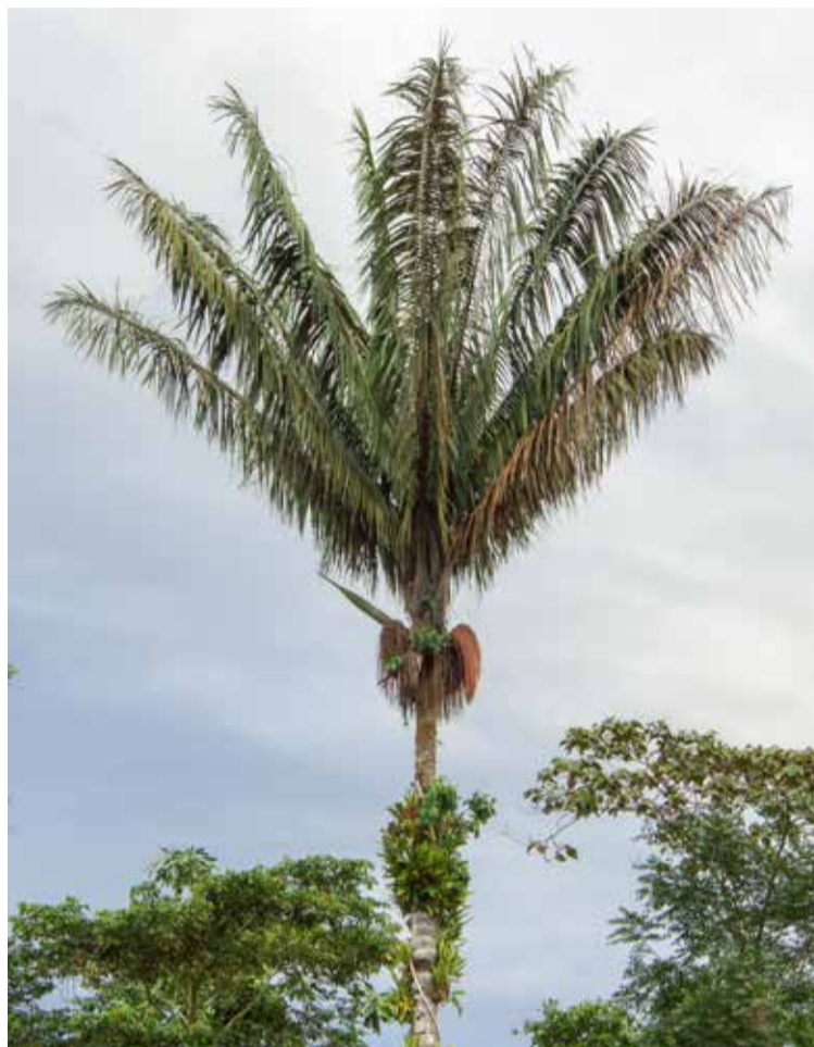
Se trata de dos especies de palmas poco estudiadas y de alta presencia en el suroccidente colombiano, en donde el espectro de investigación y consumo se suele limitar a la palma de coco.

No obstante, ahora la especie O. mapora , o palma «Mil Pesillos» – como se le conoce en la zona–, demostró tener mayor contenido de compuestos orgánicos como fenoles, antocianinas monoméricas y mayor capacidad antioxidante, frente a la «Mil pesos»