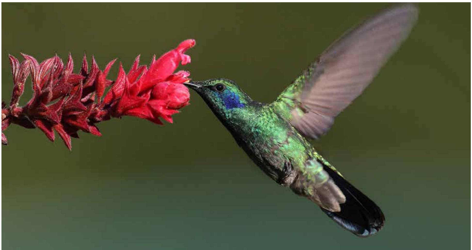
Colibrí verdemar libando néctar.

Colombia 'el País de la Belleza', volvió a demostrar por qué es el destino perfecto para los observadores de aves y la segunda nación más biodiversa del planeta. La plataforma eBird, desarrollada por la Universidad de Cornell, en Estados Unidos, informó que en el October Big Day en Colombia se avistaron 1.404 especies, 15 más que en 2023 cuando el número fue de 1.389, ocupando nuevamente el primer lugar en el mundo en avistamiento de aves. Perú ocupó el segundo