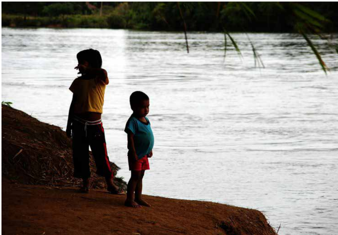
De 1.065 niños en Arauca, el 19 % presentó índices de talla baja y el 18 % tiene riesgo de obesidad.

En el departamento de Arauca residen 34.000 venezolanos, el 65 % de ellos (22.113) en su capital. Dichos migrantes han llegado en busca de mejores condiciones