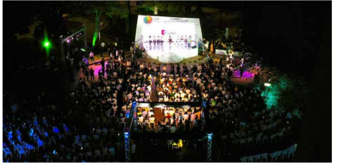
Cali a partir de hoy se visite de COP 16

Pero por encima de los asuntos técnicos y formales que demanda el evento como resultado de una agenda multilateral de la Organización de las Naciones Unidas (ONU), en nuestro país. Cali y el Valle del Cauca