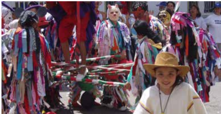
Alegoría a las danzas pijao Baile de matachines

Superados estos escollos, arriban al Valle de las Lanzas, denominación dada porque los originarios únicamente empleaban lanzas; iniciándose en la meseta fieros enfrentamientos con los milenarios Panches y Pijaos, doblegados por